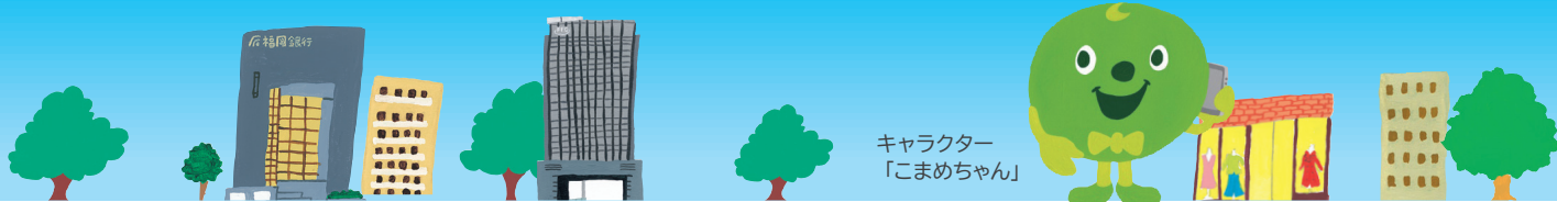
キャラクター 「こまめちゃん」